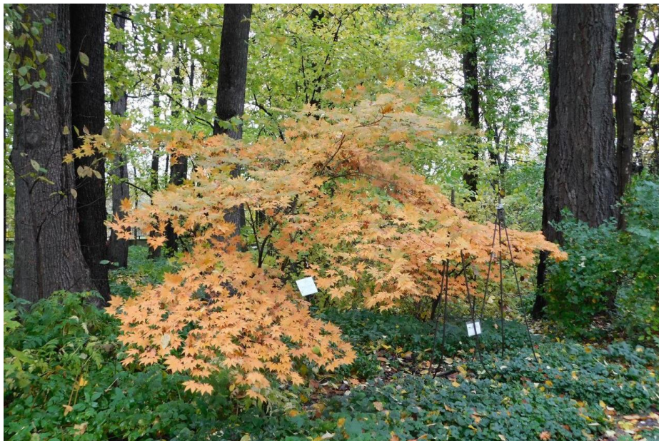
Рис. 8. Acer pseudosieboldianum (Pax.) Kom.

Среди видов коллекции есть и такой представитель, который не стоит рекомендовать для широкого введения в культуру, скорее наоборот требуются неотложные меры по мониторингу и уничтожению его инвазивных популяций. Это североамериканский Acer negundo L., который является агрессивным инвазионным видом, он активно заселяет разнообразные местообитания, сдерживая рост и развитие аборигенных видов [2]. Скорость расселения клена ясенелистного составляет до 1 м/год, а при случайном участии транспорта или распространении семян по воде – до 100 м/год [5].