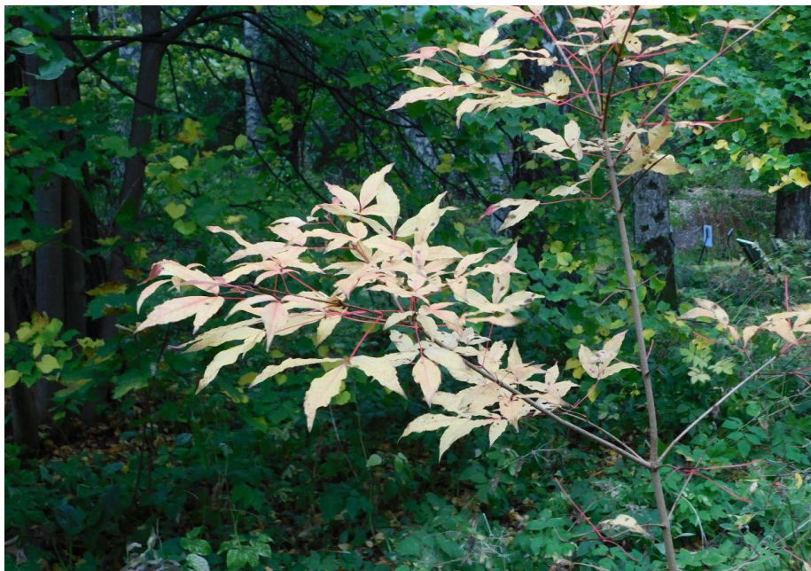
Рис 4. Acer negundo L. «Elegans»

Весьма декоративный представитель семейства Acer cissifolium К.Коч (рис. 5) может быть рекомендован к широкому применению в озеленении только при строгом соблюдении правил агротехники. Данный вид оказался среднезимостойким, отмечается ежегодное обмерзание различной степени годовых приростов в условиях Сада.