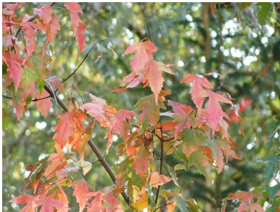
Рис. 9. Acer ginnala Maxim.

Одним из показателей интродукционной устойчивости является семенное возобновление. Опыты по проращиванию семян плодоносящих видов показали у видов Acer platanoides , Acer pseudosieboldianum (рис. 8), Acer barbinerve , Acer ginnala (рис. 9),