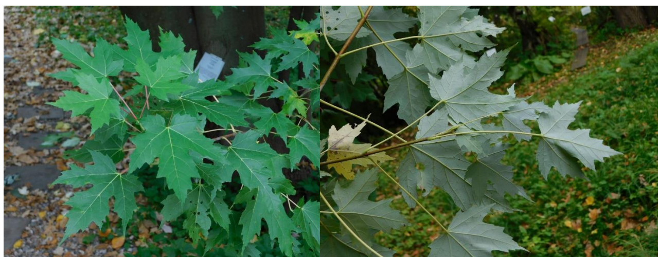
Рис. 3. Acer saccharum Marsh.