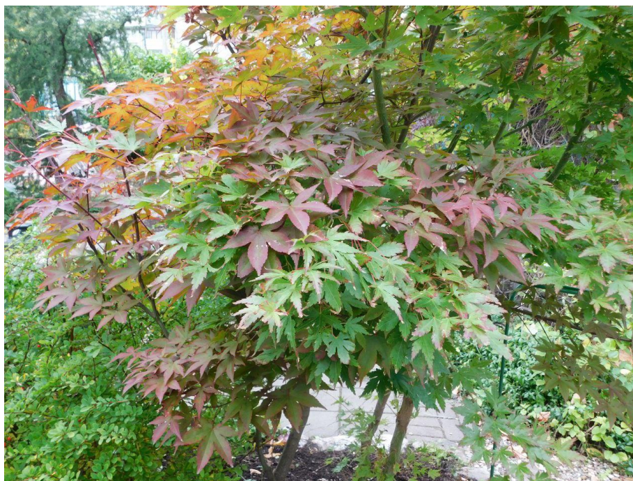
Рис. 6. Acer palmatum Thunb

Неперспективным в силу своей крайне низкой зимостойкости оказался и выпавший из коллекции кустообразный сорт «Flamingo» клена ясенелистного.