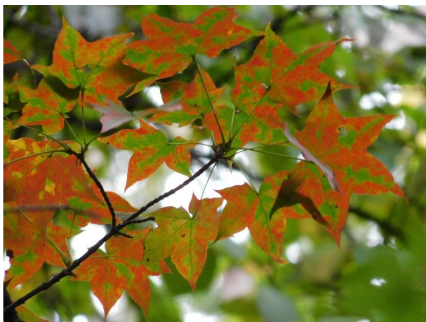
Рис. 1. Acer mono Maxim.