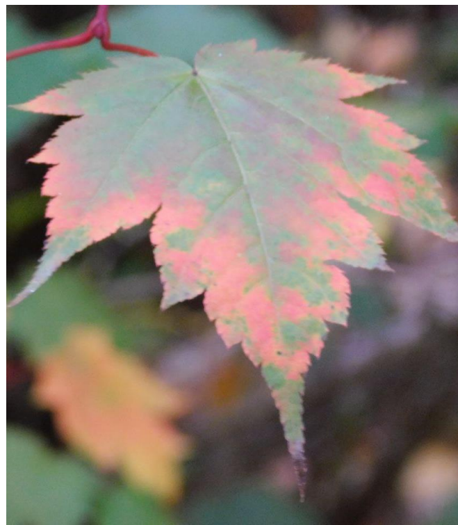
Рис. 7. Acer komarovii A. Pojark