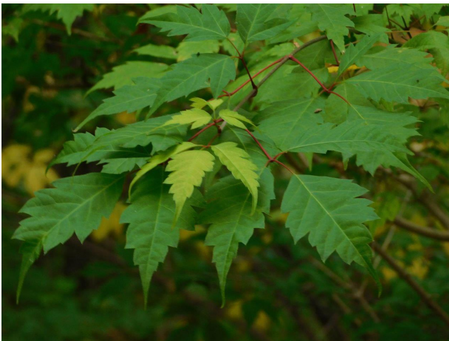
Рис. 5. Acer cissifolium К.Коч

Восточноазиатский вид Acer palmatum Thunb. (рис. 6) также отличается средней зимостойкостью. В отдельные годы приросты могут обмерзать до уровня снегового покрова. Для более широкого введения этого вида в культуру в данных климатических условиях мы рекомендуем строгое соблюдение агротехники (выбор солнечных безветренных мест с глубоким залеганием грунтовых вод) с укрытием на зиму.