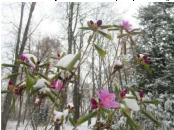
Рис. 2. Rhododendron ledebourii, 30.03.2020

Исходя из этого, можно сказать, что цветение представителей рода Rhododendron в целом длится почти 3 месяца. Вместе с тем, в зависимости от климатических условий того или иного года, время наступления и длительность цветения может меняться. Так, в 2017 г., когда в г. Твери средняя температура апреля была ниже средней многолетней этого месяца на 1,7°C (наблюдались заморозки в середине месяца), мая – ниже на 2,2°C, цветение R. ledebourii было отмечено 1-12 мая. В 2020 г. при средней температуре января выше средней многолетней на 7,4°C, февраля – выше на 7,3°C, марта – выше на 0,6°C R. ledebourii начал формировать бутоны уже в январе, к концу марта раскрылись единичные цветки (рис. 2). Однако в связи с затяжной весной (средняя температура апреля 2020 г. – ниже средней многолетней на 1,9°C, мая – ниже на 2,4°C) суммы эффективных температур было недостаточно для дальнейшего распускания цветков, оставшиеся бутоны так и не раскрылись (рис. 3).