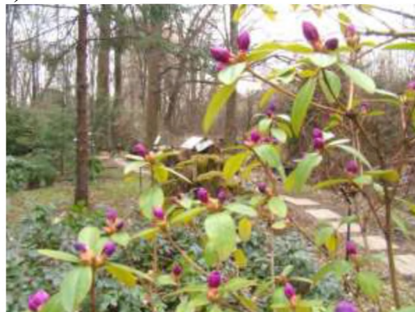
Рис. 3. Rhododendron ledebourii, 12.04.2020

Специалистами Центрального ботанического сада НАН Беларуси [1] отмечено нарушение процесса цветения рододендронов связанное главным образом с повреждением генеративных почек в зимний период после продолжительных оттепелей, либо ранневесенними заморозками. Данное явление также справедливо и для условий г. Твери по многолетним наблюдениям коллекции в Ботаническом саду ТвГУ.