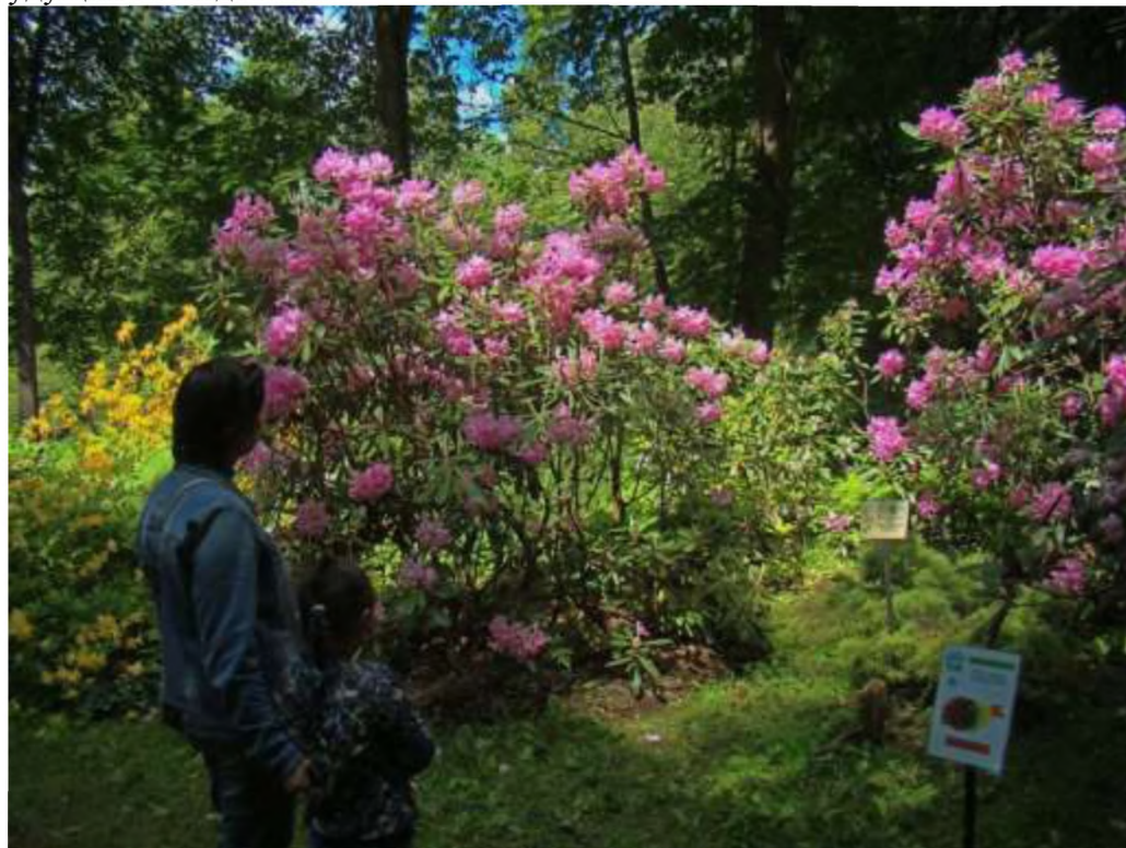
Рис. 4. Экспозиция «Вересковый сад» в Ботаническом саду ТвГУ. R. japonicum «Aureum», R. luteum , R. smirnowii , R. insigne (слева направо)

семян собственной репродукции и выведение новых сортов. Этому будут посвящены темы будущих исследований.